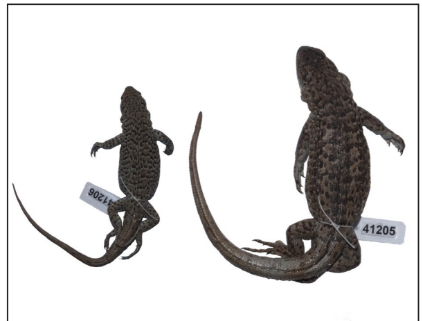
Figura 1. Liolaemus carlosgarini . Hembra juvenil (MZUC 41206) y hembra adulta (MZUC 41205).

Comentarios — Liolaemus carlosgarini es una especie de cuerpo delgado, con extremidades moderadamente robustas, tamaño mediano, con una longitud hocico-cloaca promedio de 60,7 mm y un máximo de 68,8 mm (Fig. 1). Su cola es 1,5 veces más larga que el cuerpo. Posee entre 86 y 101 escamas alrededor de la mitad del cuerpo. Su color de fondo es ocre, con una franja occipital oscura. Las franjas parietales son del color de fondo, mientras que las franjas laterales son del color de la franja occipital. El análisis filogenético sustentado en morfología externa posiciona a esta especie dentro del complejo elongatus-kriegi , diferenciándola de casi todas las especies de este grupo por la extrema reducción en los poros precloacales (Esquerré et al. , 2013). Tanto los